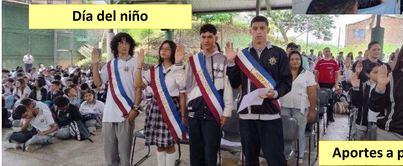
Aportes a proyectos