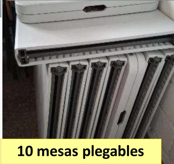
10 mesas plegables