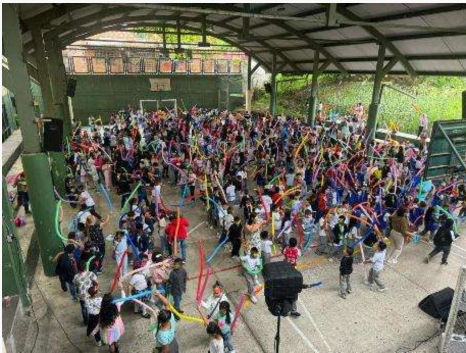
Día del niño