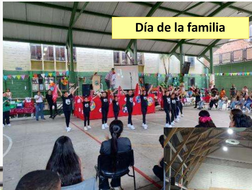
Día de la familia