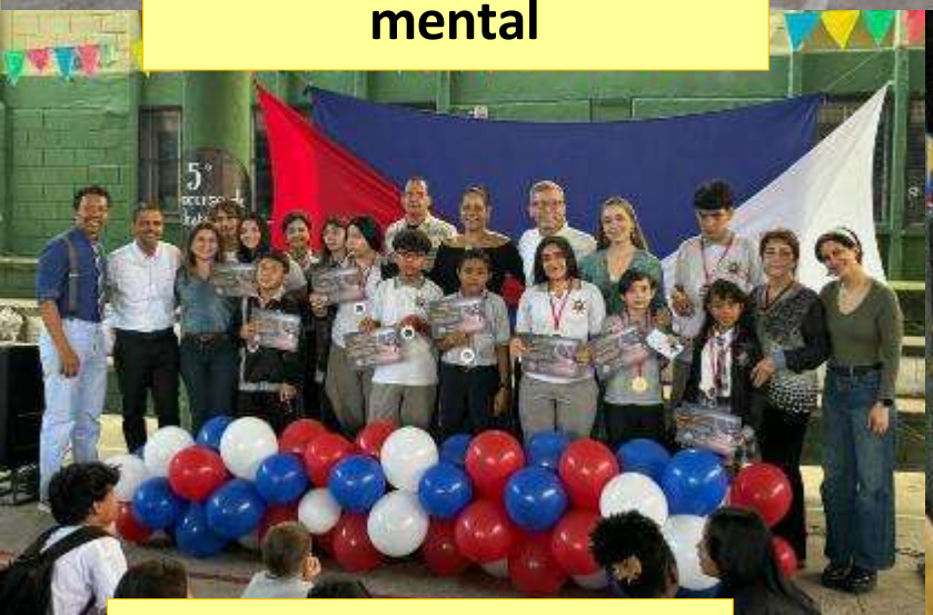
Concurso de oratoria