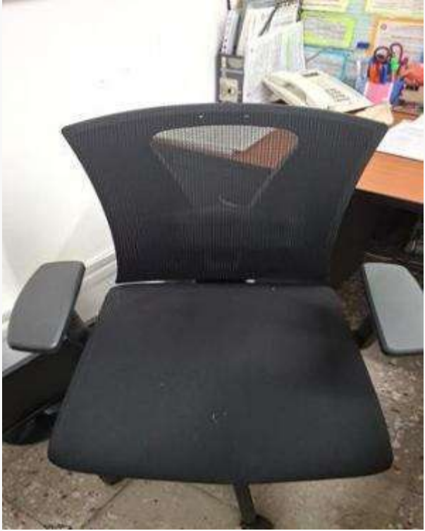
3 sillas para auxiliares