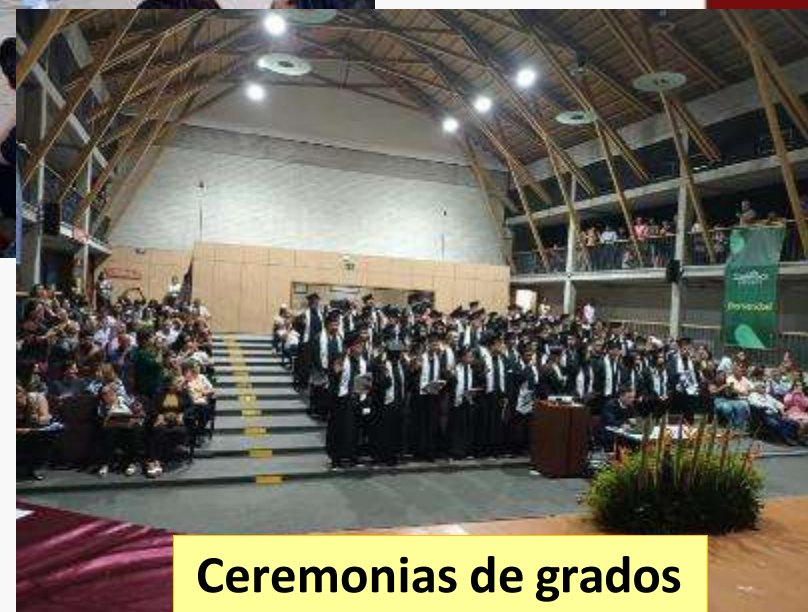
Ceremonias de grados