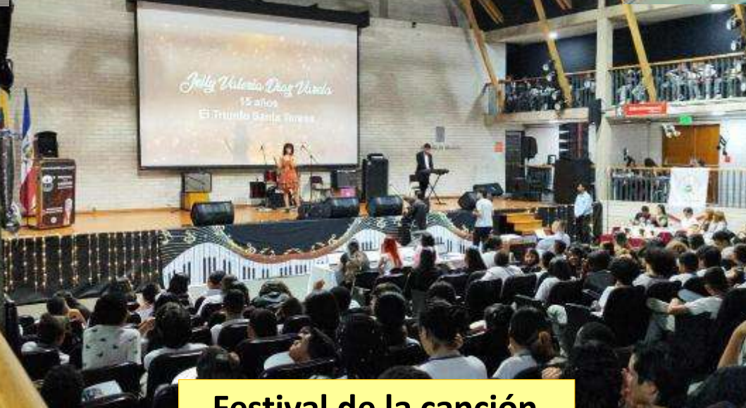
Festival de la canción