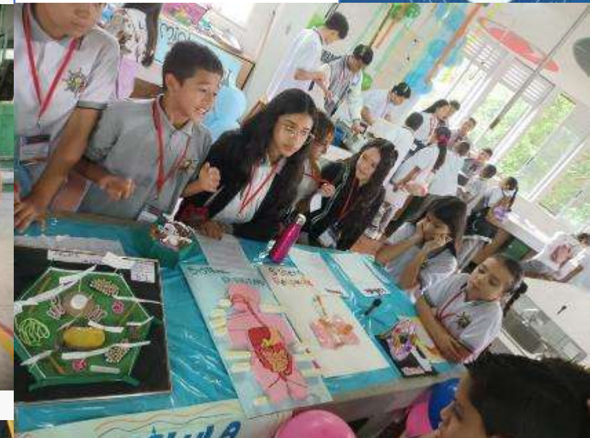
Feria del conocimiento