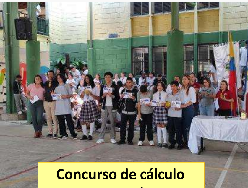
Concurso de cálculo mental